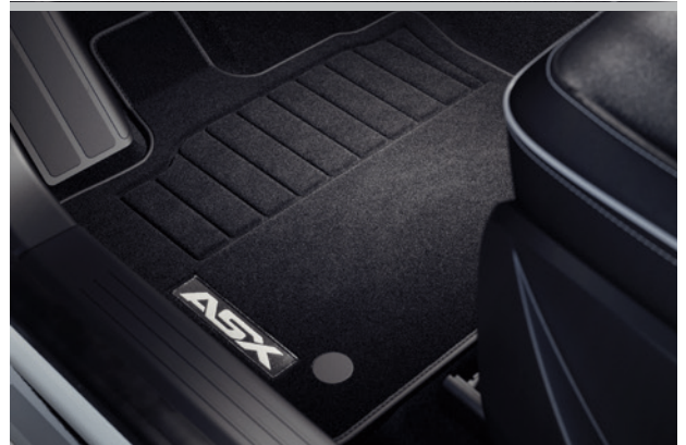
▲ Textilmatten-Satz Elegance. MZ315370