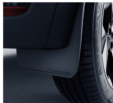
▲ Schmutzfänger-Set Kann für vorne oder hinten verwendet werden. MZ315356