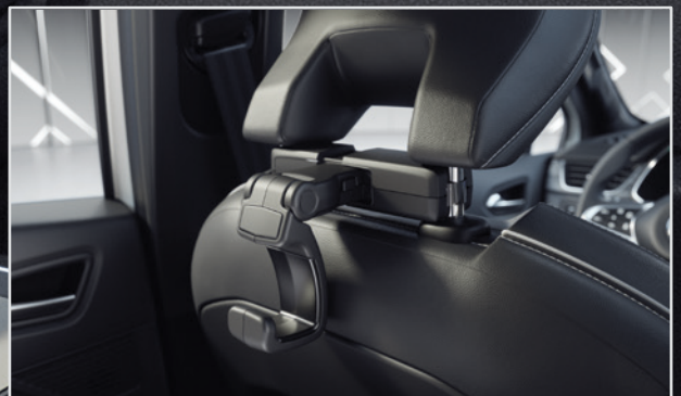
Reise- & Komfortsystem ▲ Haken. MME03C04