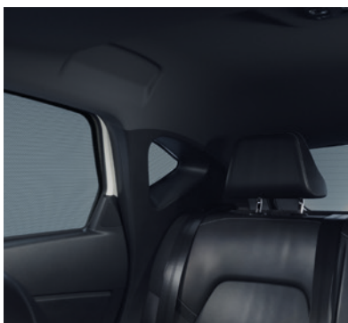
▲ Sonnenschutz-Blende Für die hinteren Seitenfenster, Viertelfenster und die Heckscheibe. MZ315404