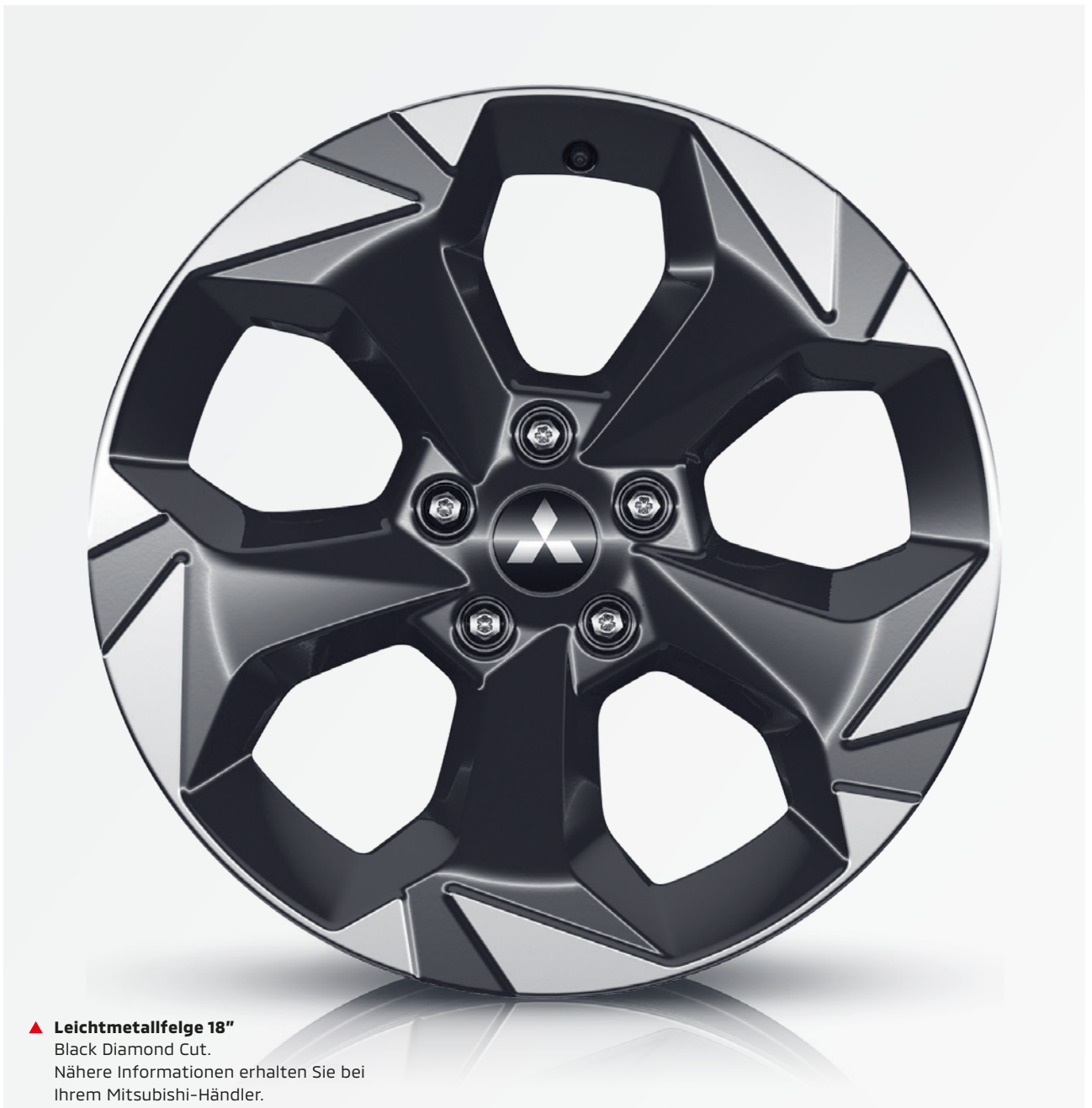
▲ Leichtmetallfelge 18" Black Diamond Cut. Nähere Informationen erhalten Sie bei Ihrem Mitsubishi-Händler.