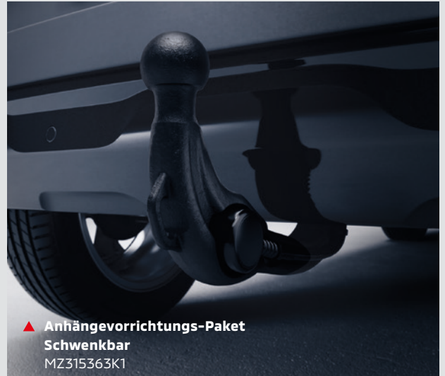
▲ Anhängervorrichtung-Paket Schwenkbar MZ315363K1