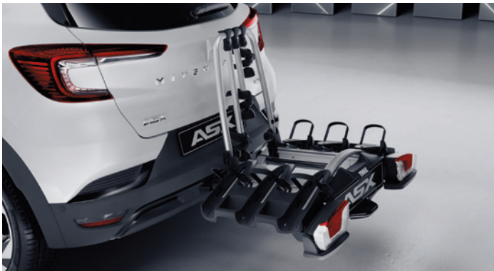
▲ Heckfahrradträger Für bis zu 3 Fahrräder. MZ315375