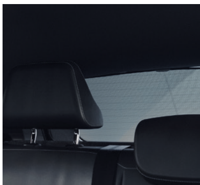
▲ Sonnenschutz-Blende Für die hinteren Seitenfenster. MZ315405