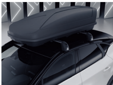
▲ Dachbox 480 Liter. MZ315377