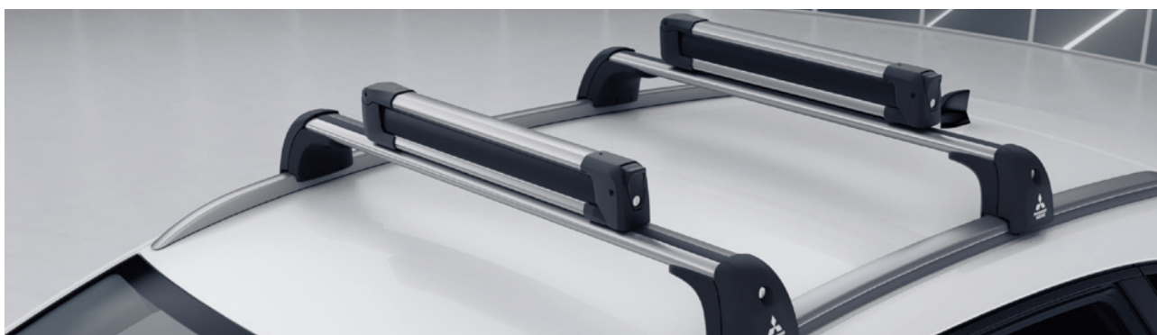
▲ Ski- und Snowboardträger Für 4 Paar Ski oder 2 Snowboards. MZ315029