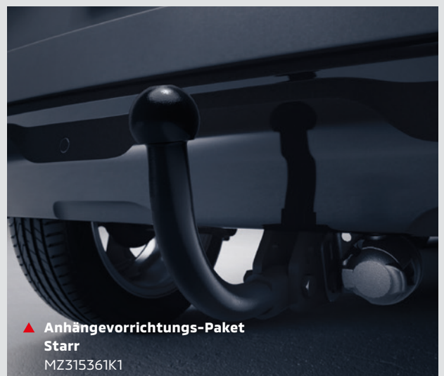
▲ Anhängervorrichtung-Paket Starr MZ315361K1