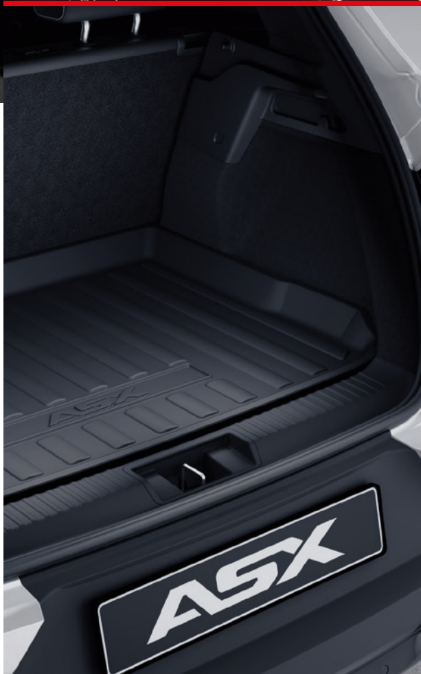
▲ Laderaumwanne MZ315372