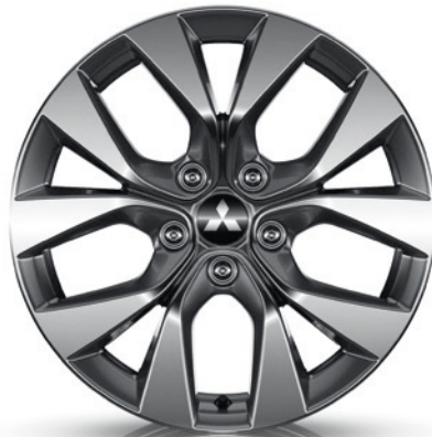
▲ Leichtmetallfelge 17" Grey Diamond Cut. MZ315347 Empfohlene Reifengröße: 215/60 R17