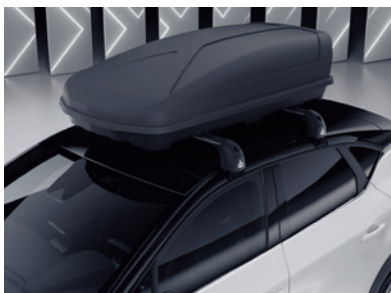
▲ Dachbox 380 Liter. MZ315376