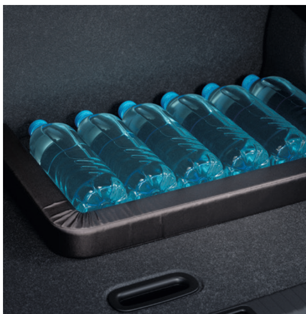
▲ Kofferraum-Organizer MZ315394

Sorgfältig abgestimmt auf Ihr Fahrzeug, wird das Original Zubehör von Mitsubishi Motors maßgeschneidert, um eine perfekte Passform und optimale Funktionalität zu gewährleisten. Das ermöglicht Ihnen das volle Potenzial Ihres Mitsubishi auszuschöpfen und Ihnen für viele Jahre eine herausragende Fahrerfahrung zu bieten.