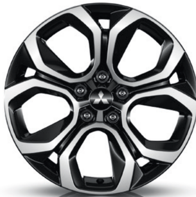
▲ Leichtmetallfelge 18" Black Diamond Cut. MQ001592 Empfohlene Reifengröße: 215/55 R18