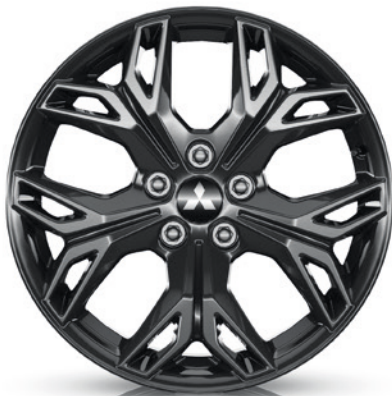
▲ Leichtmetallfelge 18" Schwarz. MZ315409B Empfohlene Reifengröße: 215/55 R18