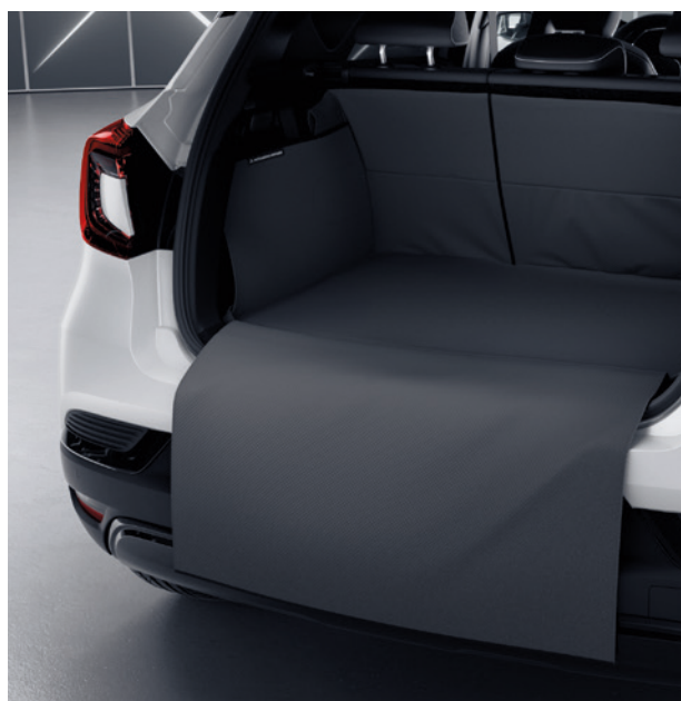
▲ Modulare Kofferraumauskleidung Einfache Befestigung. MZ315360