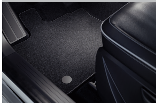
▲ Textilmatten-Satz Comfort. MZ315371