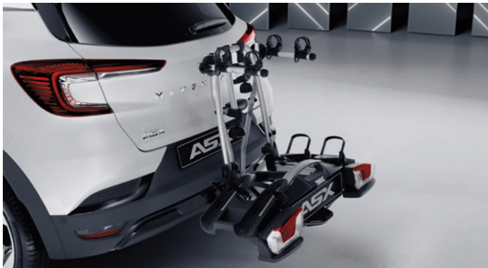
▲ Heckfahrradträger Für bis zu 2 Fahrräder. MZ314957