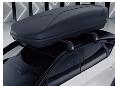
▲ Dachbox 630 Liter. MZ315378