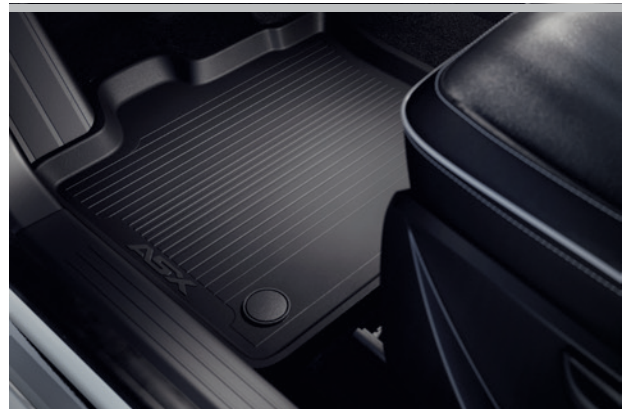
▲ Gummimatten-Satz MZ315355