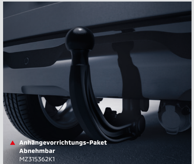
▲ Anhängervorrichtung-Paket Abnehmbar MZ315362K1