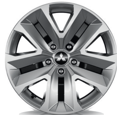
▲ Stahlfelge 17" Stahlfelge MQ001588 Radzierblende MQ001608 Empfohlene Reifengröße: 215/60 R17