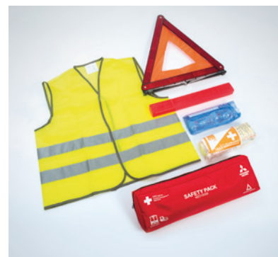
▲ Erste Hilfe-Kombi Paket Verbandstasche, Warndreieck und Warnweste. MZ315059