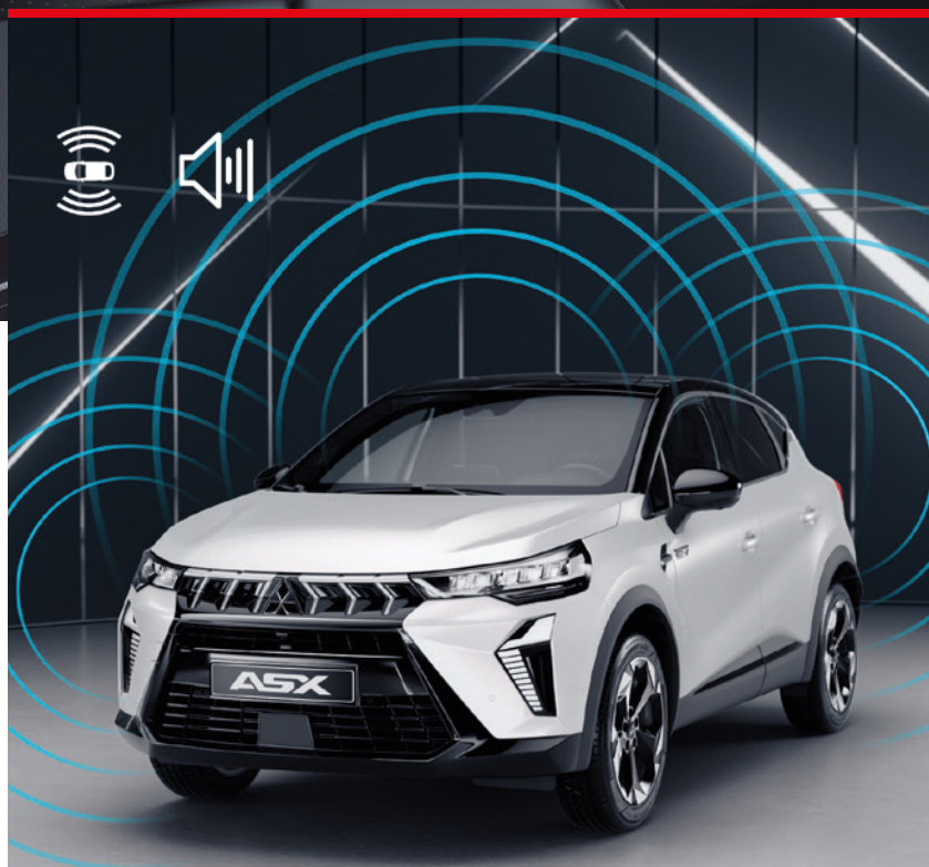
▲ Alarmanlage MZ315354