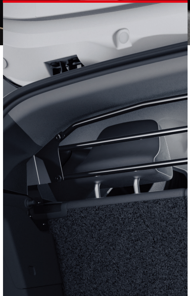
▲ Trenngitter Schwarz. MZ315353