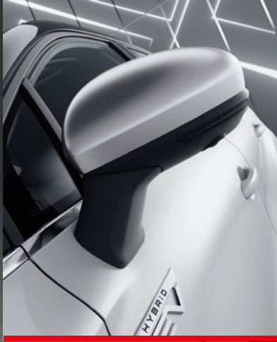
▲ Spiegelkappen-Set Satin Grau. MZ315357