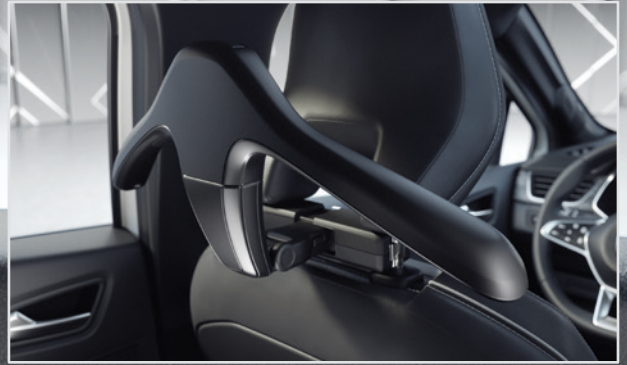
Reise- & Komfortsystem ▲ Kleiderbügel. MME03C03