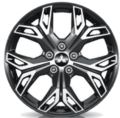
▲ Leichtmetallfelge 18" Black Diamond Cut. MZ315409BD Empfohlene Reifengröße: 215/55 R18