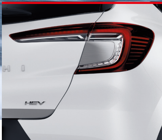
▲ Heckleuchtendekor Gebürstetes Silber. MZ315408S