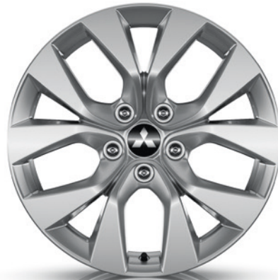
▲ Leichtmetallfelge 17" Silber. MZ315348 Empfohlene Reifengröße: 215/60 R17